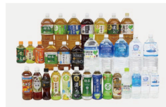
リサイクル樹脂「MR-PET®」が使われたPETボトル飲料

協栄産業グループは2011年にPETボトルを再びPETボトルに戻す「ボトルtoボトル」リサイクルを日本で初めて実現しました。新たなPET樹脂を一切使うことなくリサイクル樹脂「MR-PET®」100%で透明なボトルを作ることを可能にしたのは、実は協栄産業グループが世界で初めてです※1。さらに使用済みPETボトルから作るMR-PETは、原油から作ったPET樹脂と比較し、63%以上のCO2排出削減ができます※2。